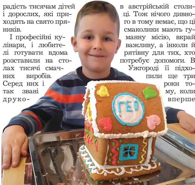
Діти із задоволенням робили пряничні будиночки, прикрашали їх і продавали

І професійні кулінари, і любителі готувати вдома розставили на столах тисячі смачних виробів. Серед них і так звані друко-