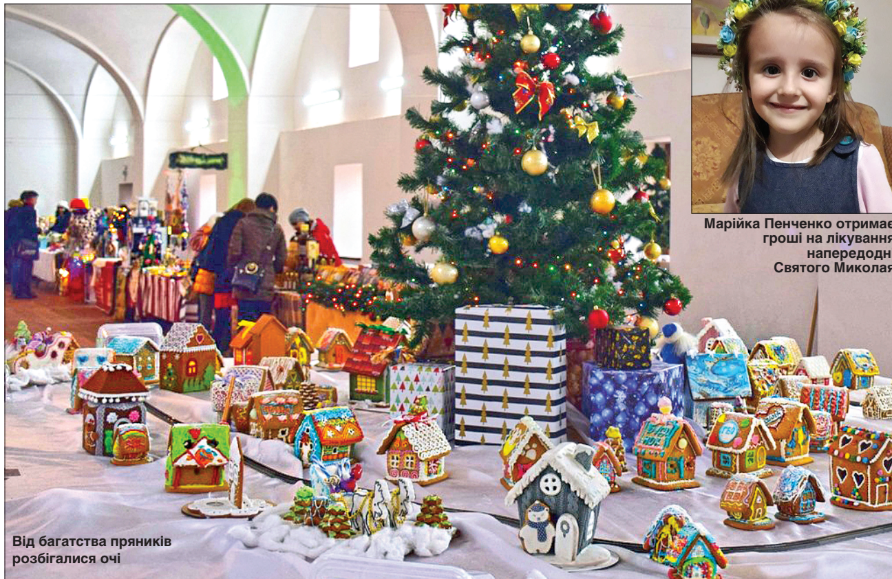
Від багатства пряників розбіглися очі

ЗАКАРПАТСЬКЕ СВЯТО. В Ужгороді пройшов пряничний фестиваль, на якому зібрали майже 25 тисяч гривень на благодійність