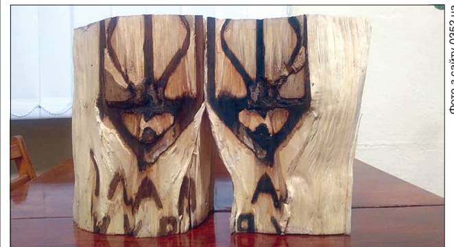
Напевно, хтось із воїнів УПА свого часу вирізьбив національний герб і гасло, які нині знайшли в колоді 90-річного дерева