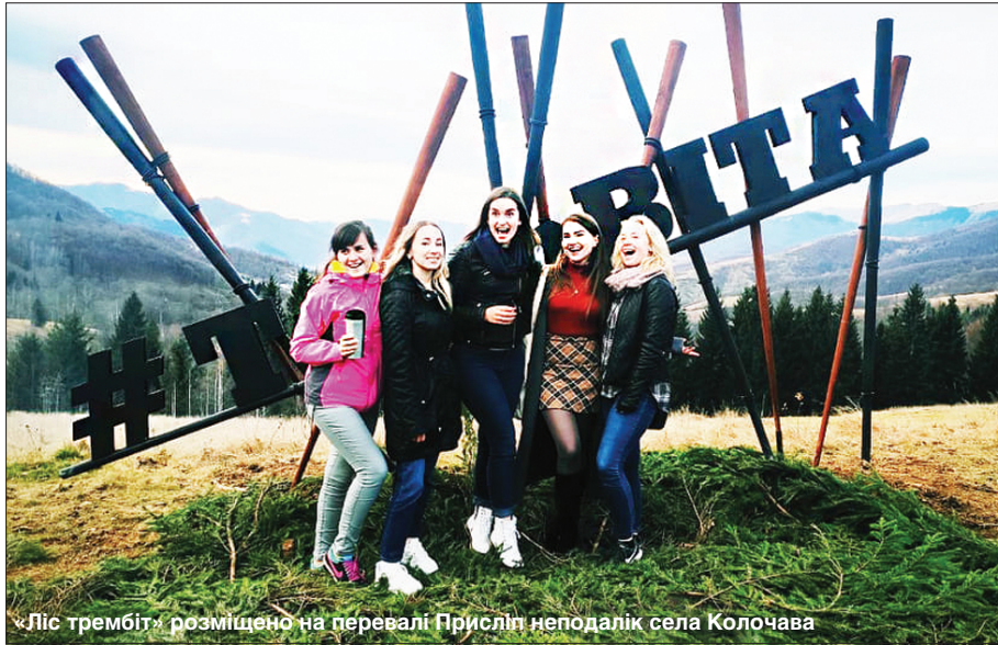
«Ліс трембіт» розміщено на перевалі Присліп неподалік села Колочава