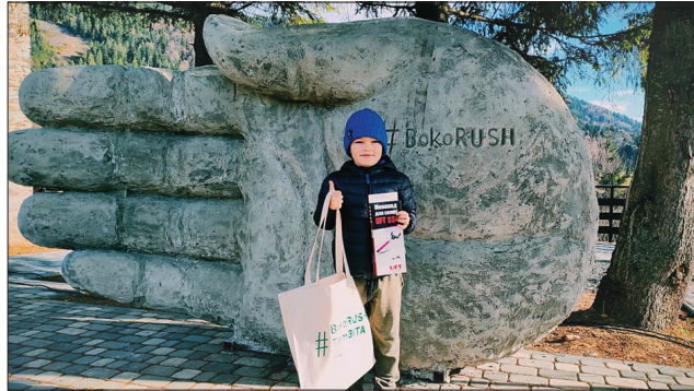
Велетенська долоня вказує напрямком до славнозвісного озера Синевир

Третю знакову споруду, відкрити у один день із першими двома, — «Ліс трембіт» розміщено на перевалі Присліп неподалік села Колочава. Тут біля цих кількадеметрових вівчарських музичних інструментів, перехрежених між собою, можна робити унікальні селфі. І цією можливістю туристи, які відвідали на вхідних село десяти музеїв Колочава, вже скористалися.