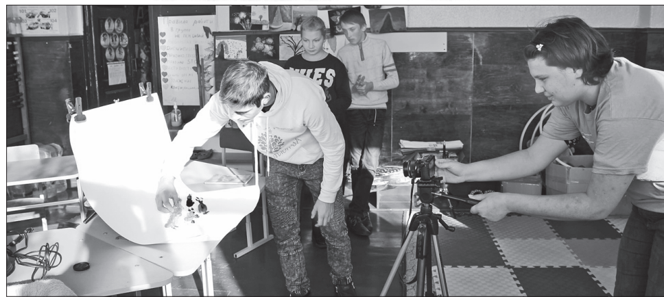
Ці ваяні комахи стали героями першого мультика, знятого дітьми

ли кімнату з необхідною технікою та сучасними меблями, які передали дітям представники БФ «Жовто-блакитні крила». Із групою дітей за-