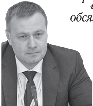
Міністр енергетики та захисту довкілля про обопільні інтереси під час перемовин з транзиту газу між Україною, ЄС і РФ

ОЛЕКСІЙ ОРЖЕЛЬ: «Має бути довгостроковий контракт з чітко визначеними обсягами, щоб, з одного боку, забезпечити прибутковість нашої газової інфраструктури. З іншого боку, європейці просять про відповідні обсяги і термін».