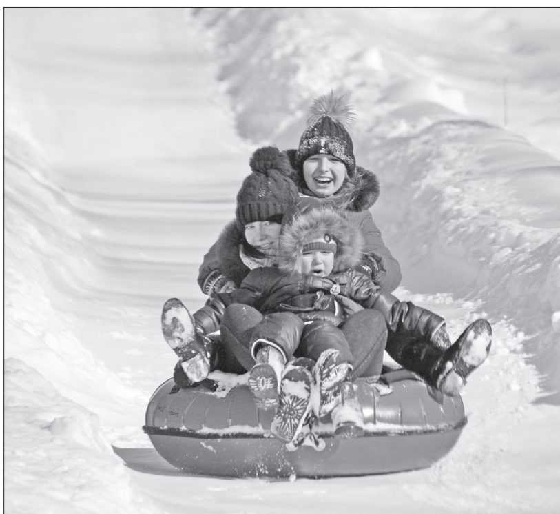
Дітям байдуже, чи це льодова гірка, чи тюбінг — прикольно й так!

Проте в дирекції парку втішають: проблема з ковзанкою тимчасова, і вона працюватиме в майбутньому.