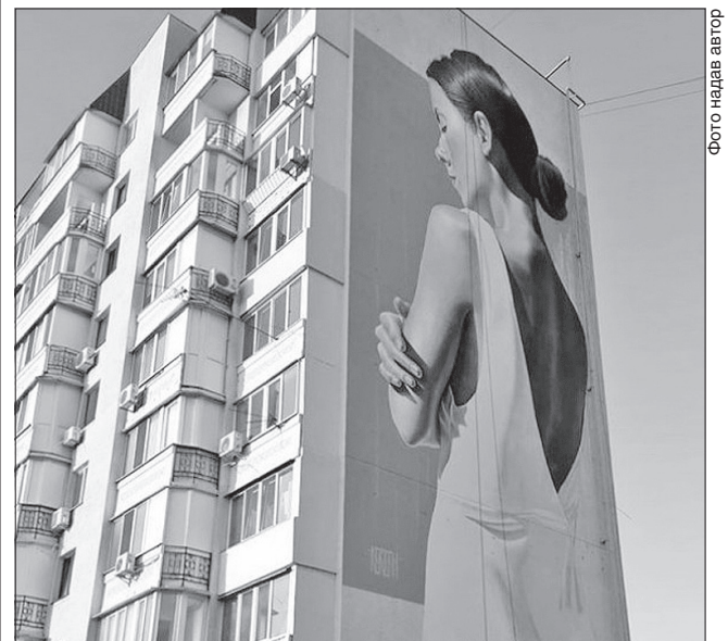
Художник закликає: «Захисти жінку!»

У Миколаєві мурал у вигляді жінки, що сама себе обіймає, намалював київський художник Олександр Корбан. Над ним митець працював дев'ять днів, намагався вкласти душу у свій твір. Він запевняє, що це малюнок про жінок, які потребують допомоги, які опинилися в стані, коли слід перебороти насильство. За даними центру соціальних служб, з початку року в Миколаєві кожна третя жінка зазнавала насилля.