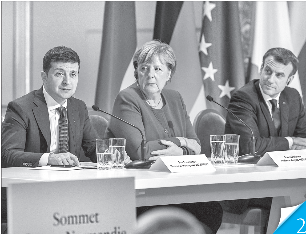
Президент Володимир Зеленський гідно склав непростий міжнародний іспит

НОРМАНДСЬКИЙ ФОРМАТ. На переговорах у Парижі Київ і Москва зробили перший обережний крок до мирного врегулювання на Донбасі