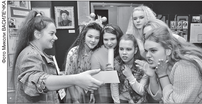
Отримали чергове завдання: «Що?! Невже?! Отакої!»

Яка команда стала найсильнішою, найзаповзятливішою та першою? Звісно ж, «Турбо». Хіба можна з такою назвою пропустити когось поперед себе? Її наздоганяла «Банда престарілих і безпомічних» й опинилася на другому місці, третіми стали «Пельмешки».