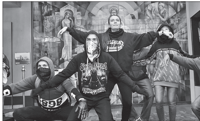
Відновлюють позиції, що зображено на малюнку: «Розправляємо крила, ой, руки. І... Невже злетимо?»