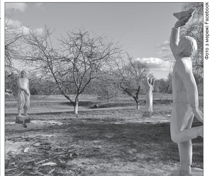
Артоб'єкти та мистецький центр приваблять туристів у село

Серед найближчих планів місцевої громади — встановити пам'ятник Миколі Стороженку та облаштувати алеї казок з героями книжок, які свого часу ілюстрував відомий земляк.