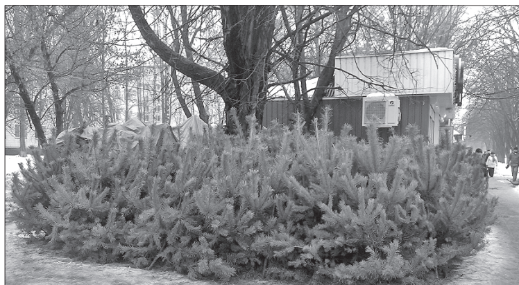
Ці красуні незабаром створять людям святковий настрій

ЗАПАХЛО ХВОЄЮ. Зазвичай ялинкові базари в Полтаві починають працювати за місяць до нового року, та вже нині в тамтешніх лісгоспах тривають хвойні жнива. Підприємливі громадяни заздалегідь придбавають певну кількість ялинок, щоб потім перепродати їх значно дорожче. Тільки лісгоспи обласного управління лісового та мисливського господарства на цей момент реалізували приблизно 10 тисяч хвойних дерев із майже 61 тисячі підготовлених для реалізації населенню. Поки що ялинки можна придбати за доступними цінами — понад 54 гривні за деревце до метра, по 96 — за 2—3-метрове. Однак із середини грудня за такі самі красуні правитимуть по 200—300 гривень і більше. Тож лісівники радять не чекати, доки ялинки подешевшають, а придбавати їх завчасно.