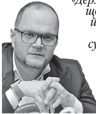
Міністр культури, молоді та спорту про розвиток цивілізованого кіноринку

«Держава зацікавлена, щоб українське кіно й серіали про нашу країну, минуле, сучасне, сьогодні з'являлися в інформаційному просторі й мали широку глядацьку аудиторію».