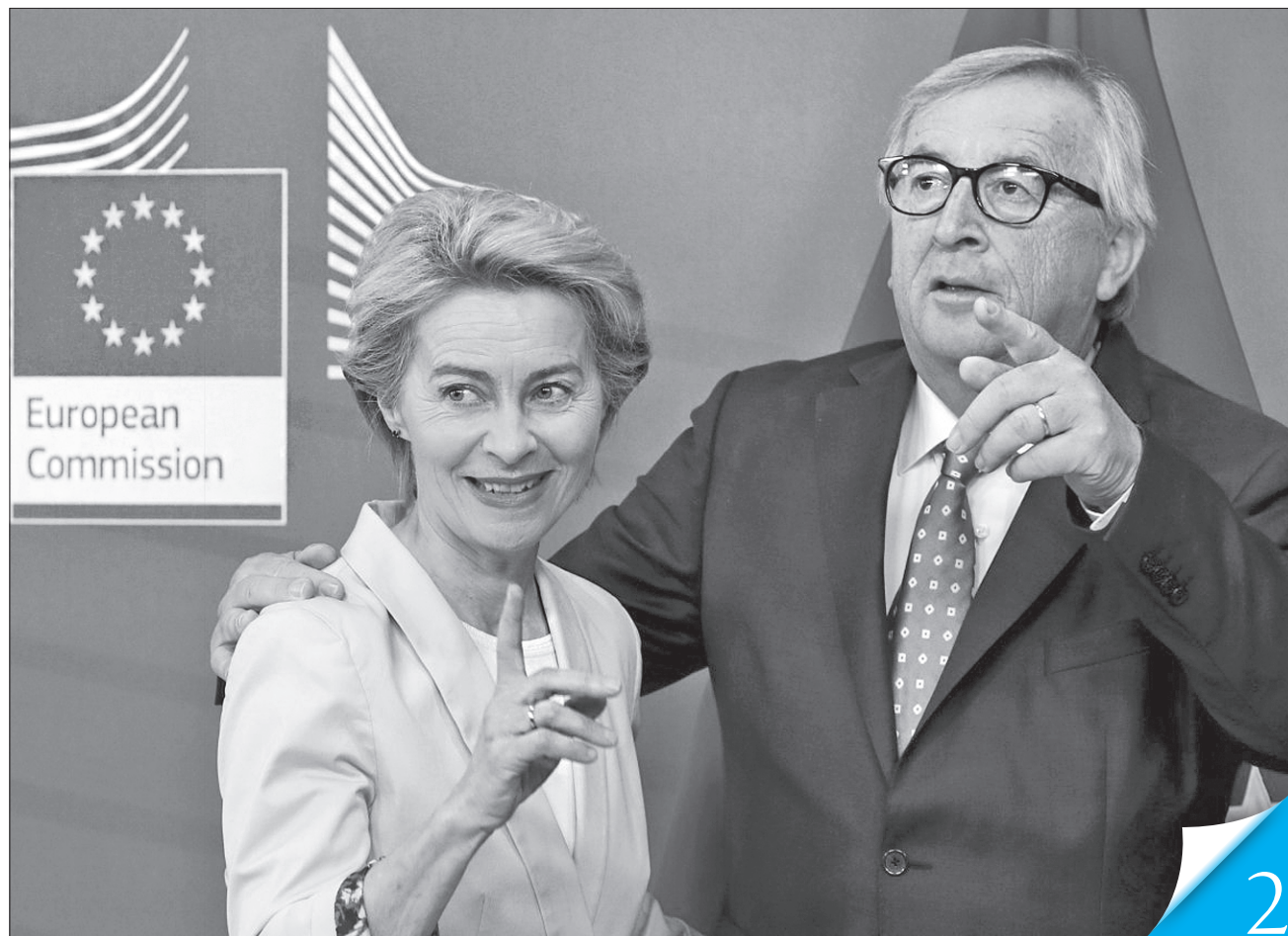
Нова голова Єврокомісії (ліворуч) обіцяє активізувати відносини ЄС з державами «Східного партнерства», до яких належить і наша країна