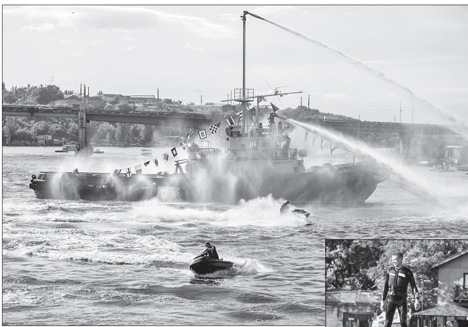
Водна феєрія приваблює численних відпочивальників. Mykolaiv River Fest вже став туристською принадою

Один із кроків до того, щоб відкрити місто туристам, — проєкт «Школа екскурсоводів», який розробив департамент економічного розвитку міської ради спільно з ГО «Фонд розвитку міста Миколаєва».