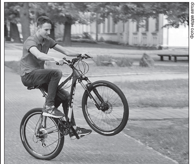
Випробування нової веломашини пройшли успішно