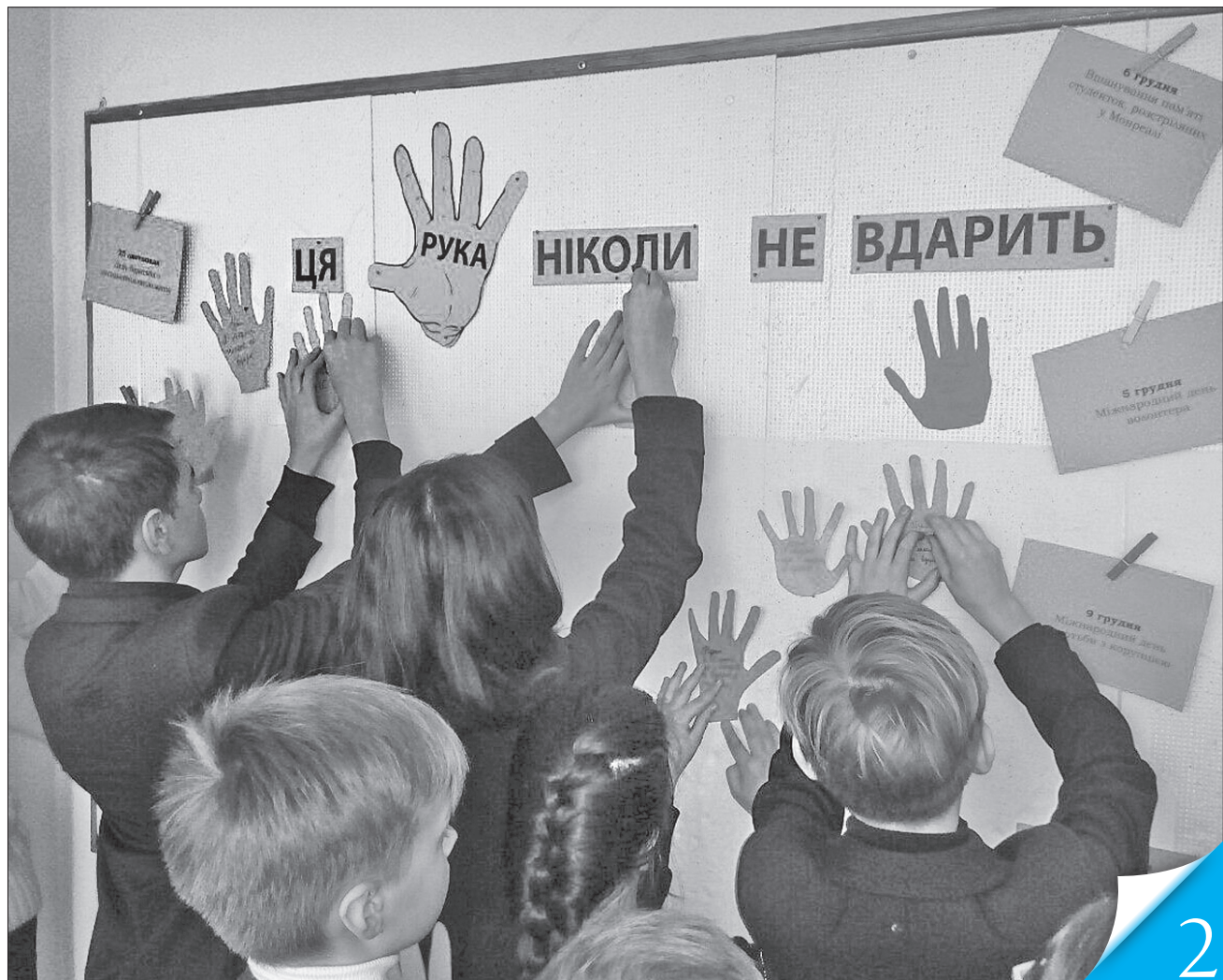
Упродовж 16 днів у школах нагадуватимуть про неприпустимість домашнього насильства

ЗА ПРАВА ЛЮДИНИ. В Україні кожна п'ята жінка потерпає від домашнього насильства. Нині їхня кількість сягає майже двох мільйонів