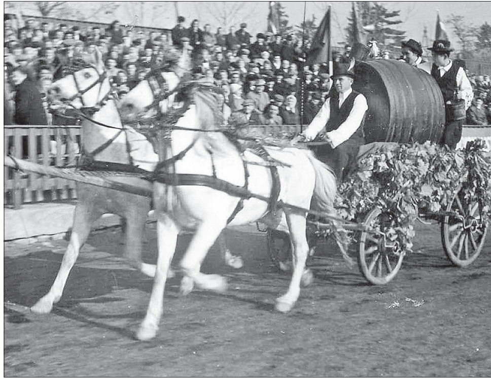
Так вшановували молоде вино до середини 1950-х на Берегівщині

Два вина з цьогорічного врожаю вже встигли визріти і готові до вживання. Це сорт угорської селекції черсегі фюсереш, автохтонний для Закарпаття, а в Україні вирощують лише на виноградниках шато Чизай. Цей сорт має арома-