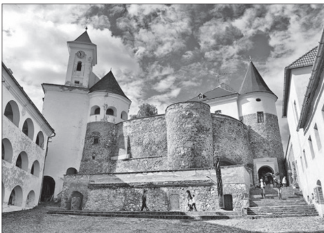
У замку Паланок стане більше інформації в сучасному форматі

Мукачівський історичний музей, що діє в замку, став учасником спільного проекту, який паралельно втілюватимуть шість музеїв в Україні, Угорщині, Словаччині та Румунії з назвою «Смарт-музей» — сучасні форми представлення