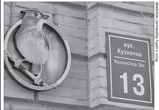
Такі симпатичні представники птахів та зникаючих рослин трапляються на фасадах будівель Харкова

А щоб мінімуралі не загубилися у вирі артоб'єктів Харкова, незабаром планують створити онлайн-карти, де всі їх позначать.