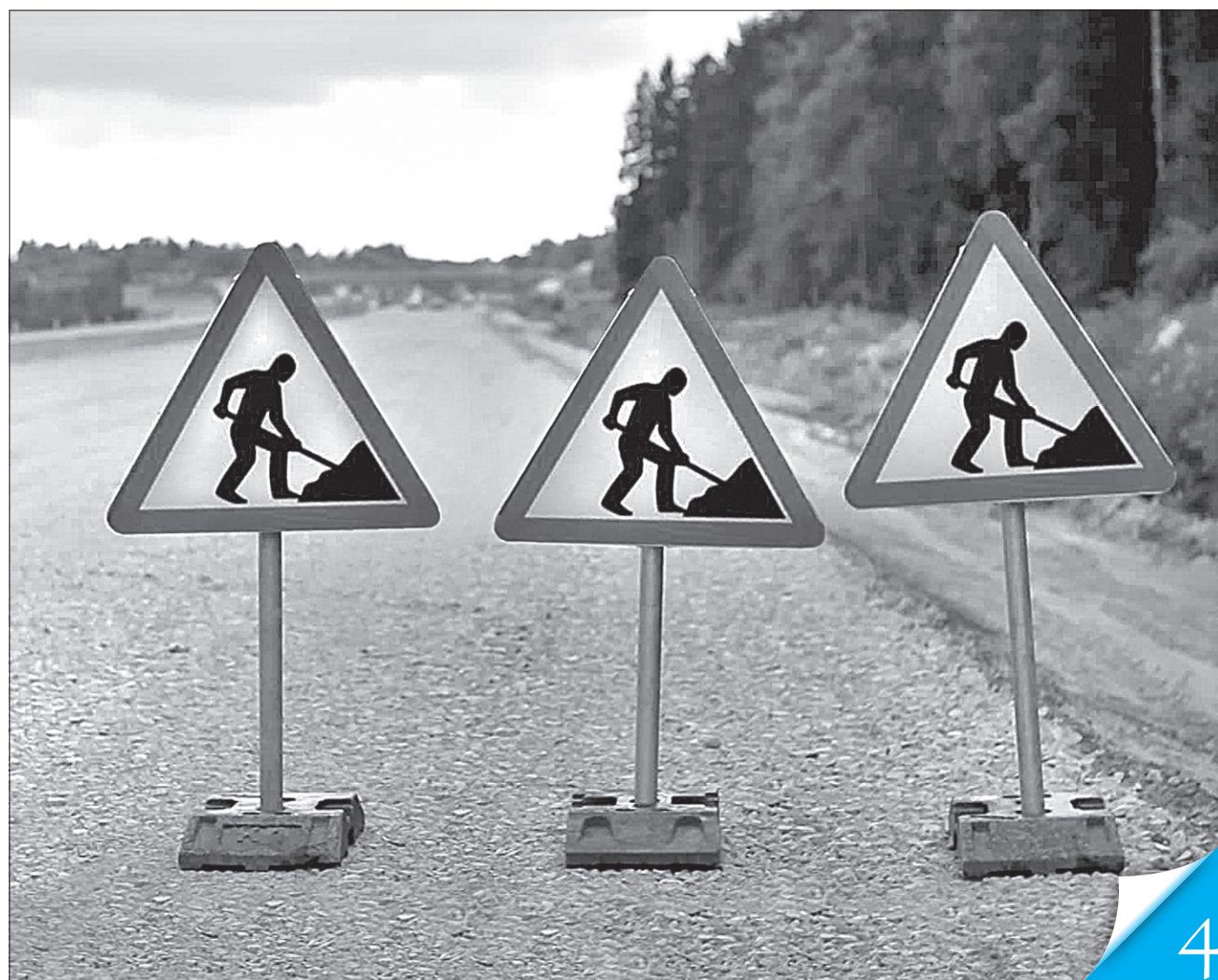
В того, хто лататиме ями й розчищатиме шляхи від снігу, мають бути не лише дорожні знаки, а ще й спецтехніка

ПОГЛЯД. Руйнуючи нинішню систему експлуатаційного утримання автодоріг, потрібно чітко усвідомлювати, що її замінить