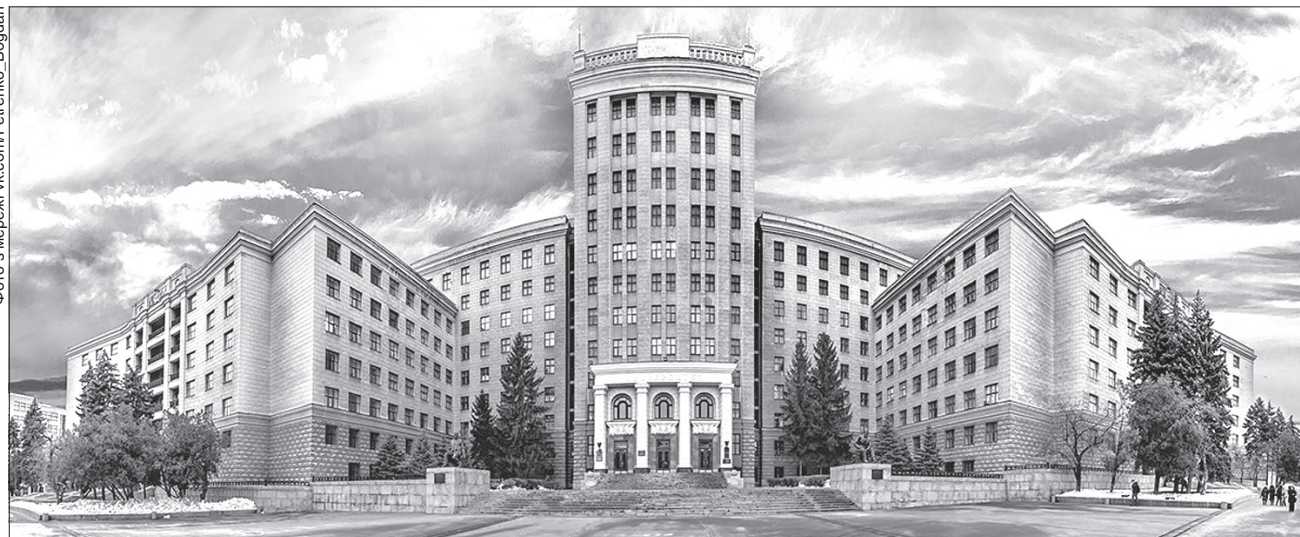
Харківський національний університет імені В.Н. Каразіна входить у список 500 найкращих університетів світу