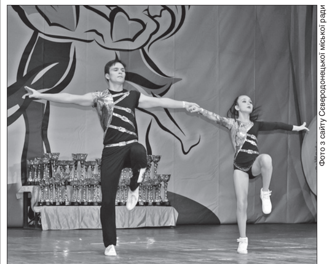
У Северодонецьку пройшов V етап чемпіонату України з акробатичного рок-н-ролу та бугі-вугі