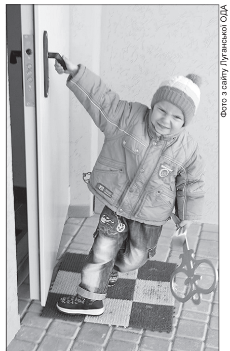
Заповітний ключ від щасливого життя

Новосели й гості разом посадили у садку яблуні.