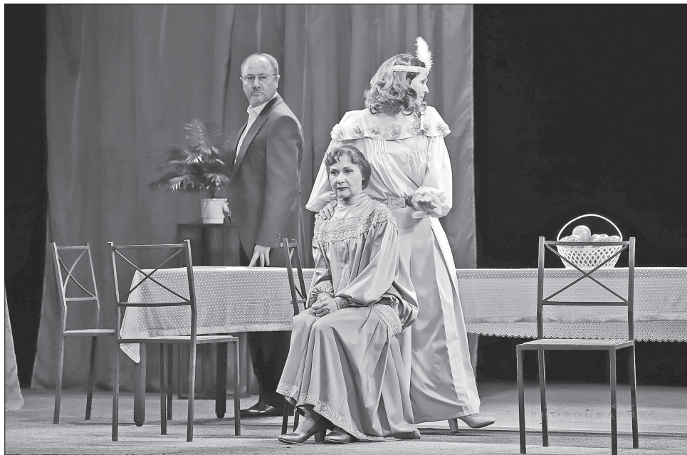
Сцени з вистави «Нормальна ненормальність»

У фестивалі брали участь десять колективів з різних куточків України, зокрема Києва, Кропивницького, Львова, Чернівців, Чернігова, а також представники Білорусі — Гомельський міський молодіжний театр та Мозирський драмтеатр ім. І. Мележа.