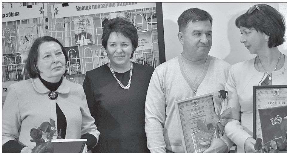
Квітів і грамот вистачило всім учасникам книжкового конкурсу

Конкурс проводили усьоме. Він став популярним на Полтавщині. У цьому заслуга передовсім департаменту інформаційної діяльності та комунікацій з громадськістю облдержадміністрації, який виступає організатором заходу, популяризує полтавську книжку. Коштом об-