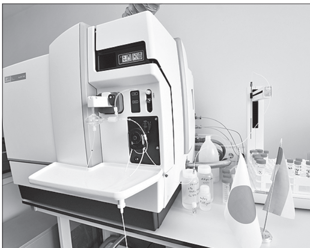
Такий вигляд має сучасний мас-спектрометр ICP-MS, який працюватиме на потреби України

агентства з науки і технологій, вчених університетів Фукусіма та Цукуба, з якими університет підписав меморандуми про співпрацю.