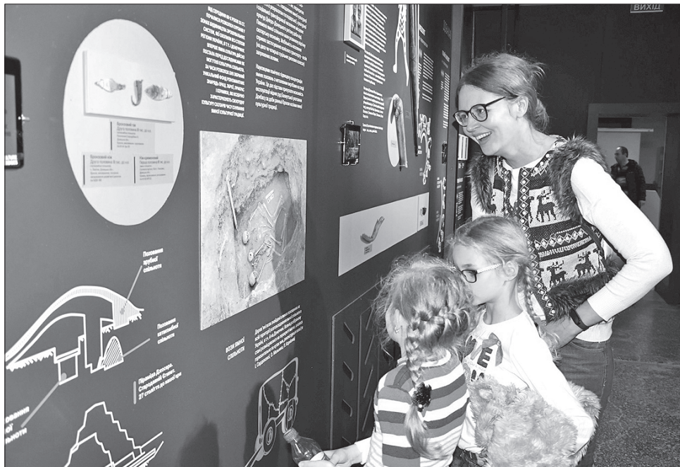
На виставці можна дізнатися про велику кількість цікавих знахідок археологів

За словами вченого секретаря обласного краєзнавчого му-