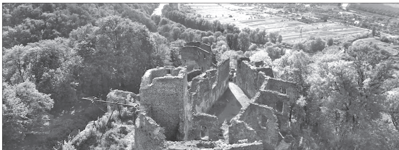
Невицький замок неподалік Ужгорода відреставрують першим на Закарпатті

У депутатів обласної ради нині на розгляді проєкт зі створення на Закарпатті історико-археологічного заповідника, який комплексно розв'язуватиме проблеми збереження і використання замків області. Для цього передбачено заснувати обласне комунальне підприємство «Замки Закарпаття».