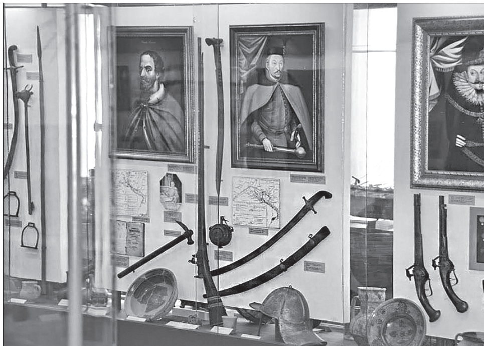
Деякі експонати у музеї представили вперше

Привертають увагу відвідувачів козацька й турецька зброя, люльки-носогрійки, монети, які були в обігу на Полтавщині в ті часи, глиняний і скляний посуд, ікони на металі з Лубенського Мгарського Спасо-Преображенського монастиря. Представлено бага-