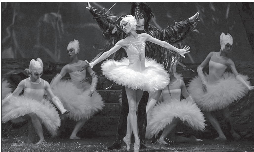
Під час вистави танцівники, наче справжні білі та чорні лебеді, опинилися у природному для себе водному середовищі

Вистава «Лебедине озеро», яку французькому хореографу допомогли втілити диригент-постановник Дмитро Морозов, художник-постановник і художник по костюмах Олександр Лапін, автор відеоконтенту Гарольд Симон, художник по світлу Тетяна Альошина, стала однією з найдорожчих за всі роки діяльності ХАТОБу.