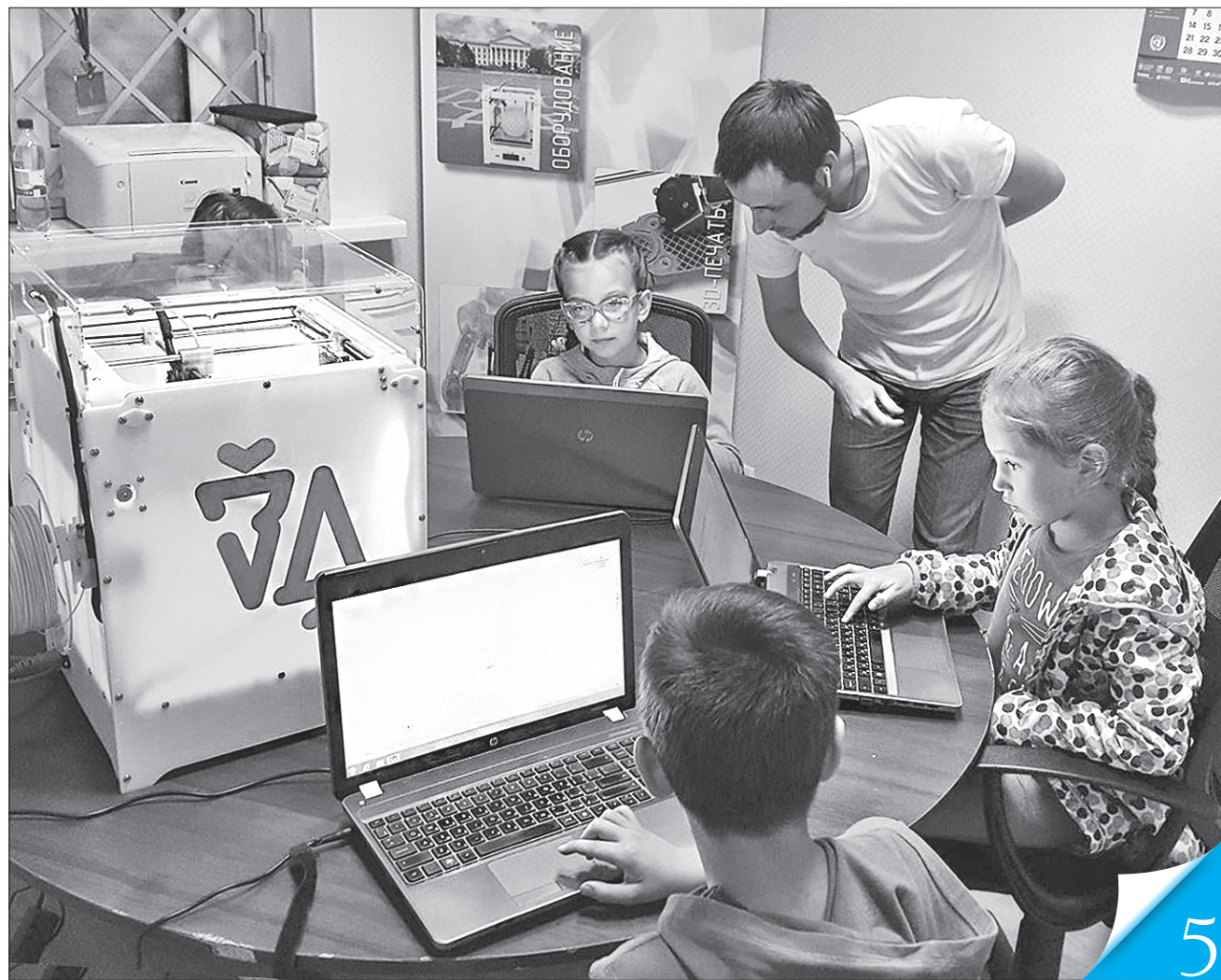
У краматорському Центрі інновацій GEEK-bunker підбрали чудову програму для школярів — модульна гра, в якій треба писати скрипти найбільш затребуваними мовами програмування

ПРОЄКТ. У межах програми ООН з відновлення та розбудови миру в Донецькій та Луганській областях відбулась поїздка групи журналістів