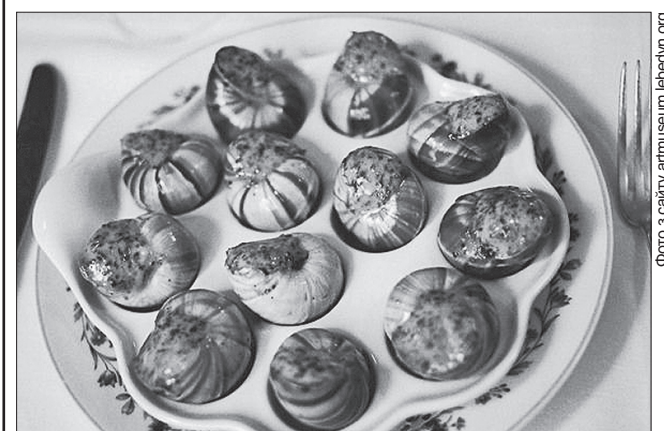
Равлики під часниковим соусом — класика французької кухні, яку можна спробувати в Україні