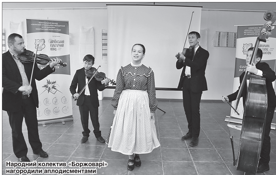
Народний колектив «Боржоварі» нагородили аплодисментами

Гості презентації оглянули виставку «Світ мережива» зі зразками великоберезького човниково-перебірного ткацтва, а також фотовиставку. На завершення фольклорний колектив «Боржоварі» з Берегівщини подарував музичні композиції, побудовані на угорському фольклорі.