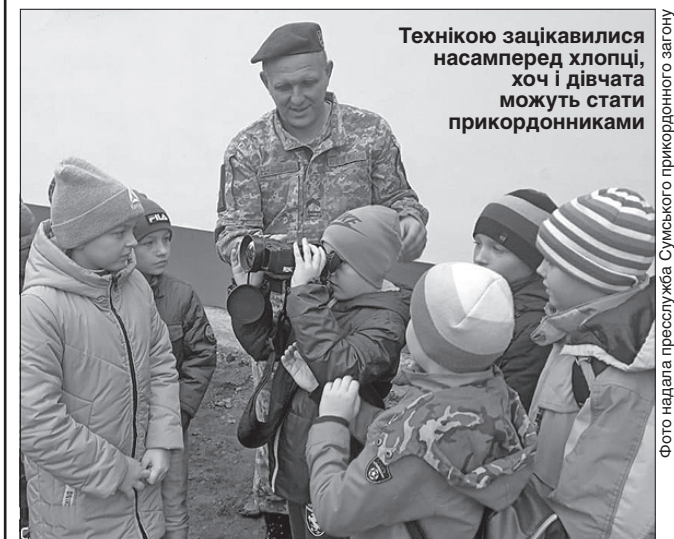
Технікою зацікавилися насамперед хлопці, хоч і дівчата можуть стати прикордонниками

Правоохоронці не тільки запросили учнів на екскурсію, а й порадили подумати над майбутньою професією. Адже і нині, і в перспективі прикордонні війська зацікавлені в молодих фахівцях, у яких охорона кордонів рідної країни стане справою життя.