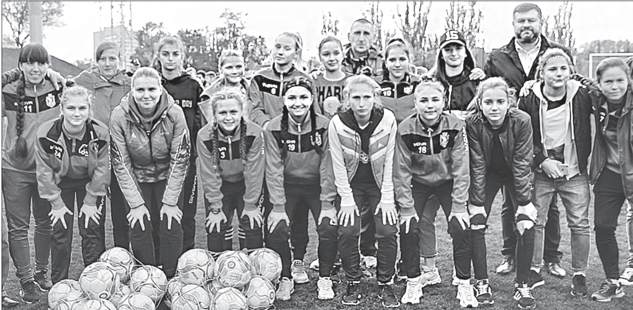
Найактивнішими учасниками свята футболу у Миколаєві стали діти

Цього дня відбувся товариський матч між збірними міста Миколаєва та Миколаївської області. У складі команд зіграли відомі політики і громадські діячі, бізнесмени й видатні спортсмени. Команду міста очолює міський голова Олександр Сенкевич, а капітаном обласної збірної був голова Федерації футболу Миколаївської області Олександр Пасічний.