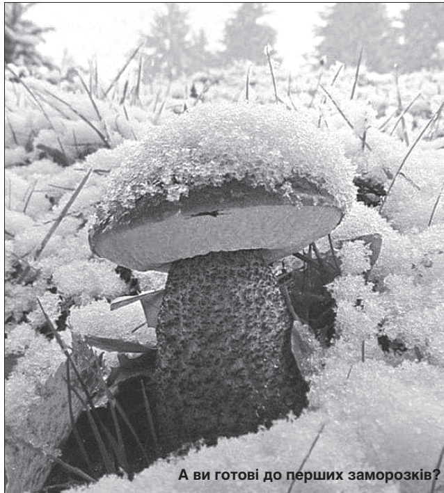
А ви готові до перших заморозків?

Хоч природні катаклізми цьогорічної весни завдали хліборобам чимало клопотів і тривоги щодо майбутніх результатів їхньої праці, урожай-2019 виявився рекордним. На сьогодні вже зібрано 58,9 мільйона тонн зерна (86% прогнозу) за середньої врожайності 45 центнерів з гектара. Показники ці ще не остаточні. Вагоме збільшення аграріям забезпечив урожай озимої пшениці, ячменю, кукурудзи, ріпаку, соняшнику. За інформацією компанії «Украгроконсалт», у 2019—2020 маркетинговому році Україна експортує майже 53 мільйони тонн зерна (у 2018—2019 МР — 49,7). Отже, як у приказці: буде борщ із грибами і піч з пирогами.