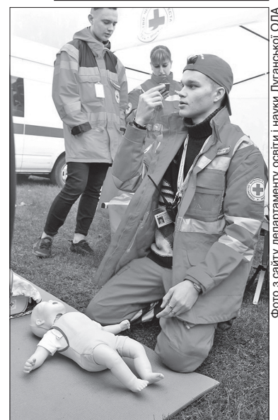
Під час обласного збору-змагання юних рятувальників «Школа безпеки» учасники продемонстрували вміння в конкурсі «Надання першої допомоги»