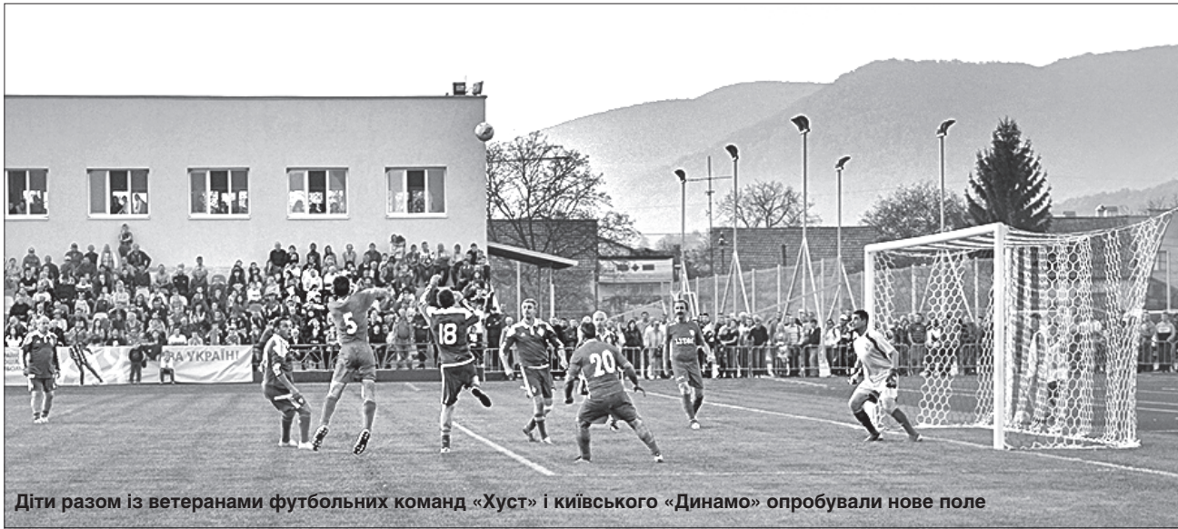
Діти разом із ветеранами футбольних команд «Хуст» і київського «Динамо» опробували нове поле