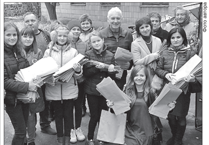
Першим кроком до оздоровлення довкілля стало виготовлення паперових пакетів