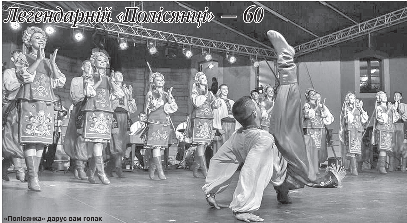
«Полісянка» дарує вам гопак