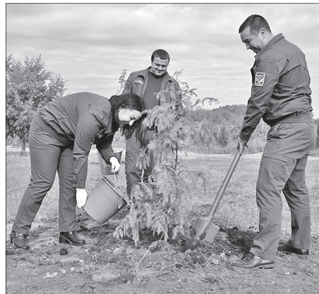
Лісівники ретельно доглядають дендропарк, поповнюючи його новими насадженнями

Дендрологічний парк слугує ще й навчальним осередком для шкільних лісництв. Сюди часто навідуються учні, щоб доглянути насадження, поповнити знання з біології.