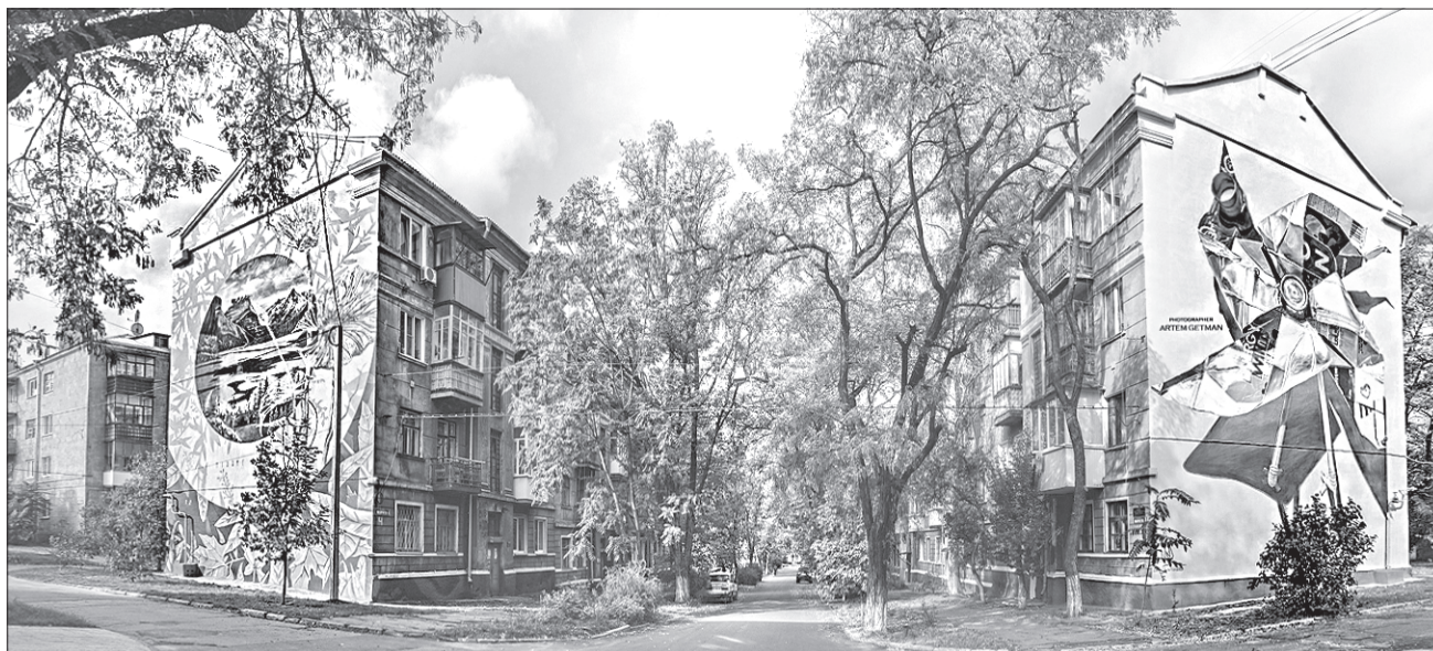
Тепер у Краматорську утворилася ціла вулиця муралів, на якій будинки прикрашені творчими роботами майстрів з різних країн