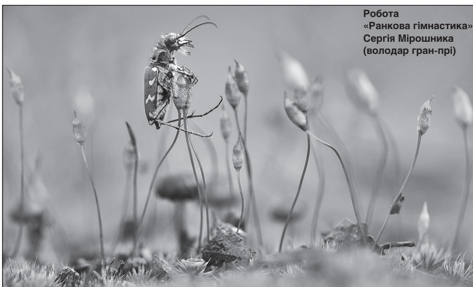
Робота «Ранкова гімнастика» Сергія Мірошника (володар гран-прі)

Усі мали змогу погортати новий каталог світлин «Фотовернісажу на Покрову-2019», зробити миттєве фото на ретрокамеру, взяти участь у розігравші подарунків лотереї «Фортуна на Покрову». Одне слово, Рівне вперше перетворюється на столицю фотографії й переадресації фотостудії цим видом мистецтва іншим: виставка найкращих світлин «Фотовернісажу на Покрову» вже їде до Хмельницького. Долучайтеся до перегляду!