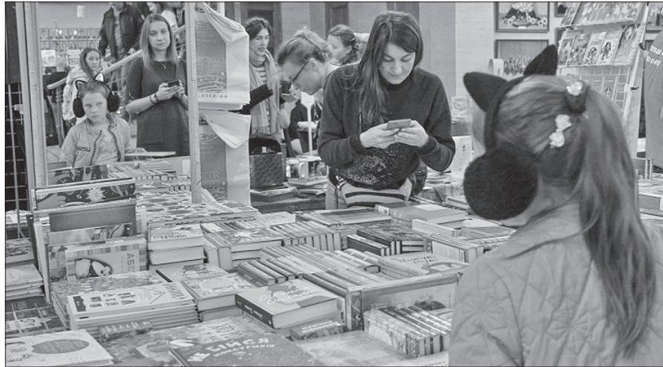
Розмаїття книжок зачарувало відвідувачів

На святі книжки було багато молоді, яка із задоволенням слухала лекції та відвідувала майстер-класи. Цікавими були зустрічі з авторами, презентації книжок, автограф-сесії. Багатьом запам'яталося спілкування з митцями всеукраїнського масштабу, зокрема поетичні читання із Сергієм Жаданом «Нові і улюблені вірші», творчий вечір Івана Малковича «від 2 до 102», виступи музичних гуртів Юрка Іздрика і Григорія Семенчука, етновечірка Дари Корній, презентації Максима Кідрука, Ірени Карпи, дискусія з Вадимом Карп'яком