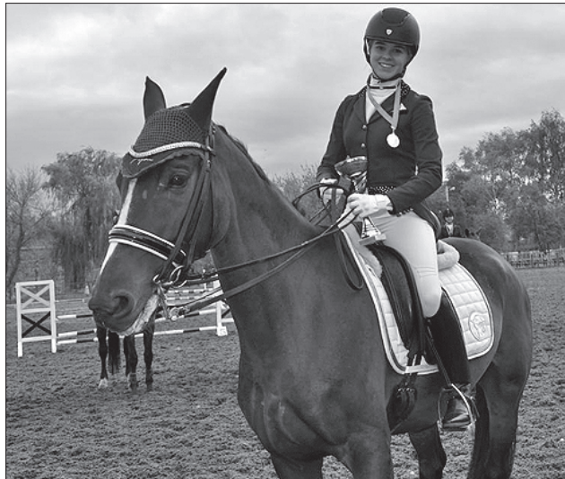
Учасники змагань показали свою майстерність та отримали кубки й подарунки від спонсорів

Як сказали директор школи депутат Сумської обласної ради Олександр Стрельченко та голова обласної організації Національного олімпійського комітету біатлоністка Олена Петрова, обласна влада піклується про заклад і його вихованців. Завдяки цьому молоді має всі умови й можливості для повноцінних занять кінним спортом, який справедливо вважають одним із найкрасивіших і граційних видів змагань.