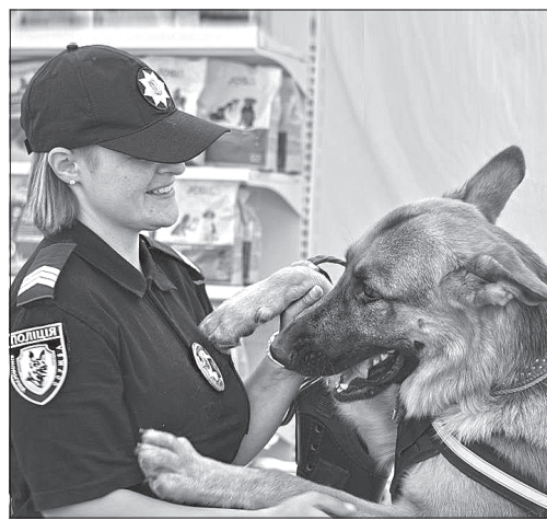
Поліцейський-кінолог та його чотирипалий помічник є грізною силою лише за умови, що вони працюють як єдине ціле. На відміну від людей, службова собака завдяки тонкому нюху здатна зреагувати на приховані від очей зброю, вибухівку, наркотики

Навіть найдосвідченіші фахівці фізично не здатні оглянути сотні закапелків, необережним рухом не спровокувавши при цьому цілком вірогідний вибух. Але це під силу спеціально навченим собакам, які реагують на запахи вибухових речовин.