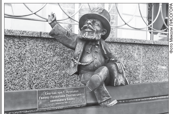
З появою у нього побратима, бронзовому Енеєві не буде самотньо