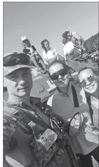
Свято зустрічі запам'ятають усі