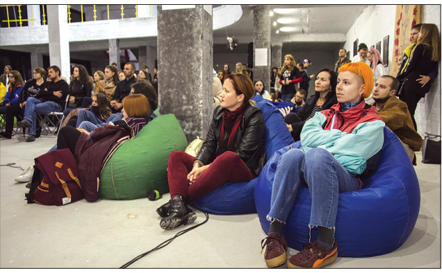
Дійство зібрало любителів сучасного мистецтва

Нинішня добірка фільмів нерозривно пов'язана з темою фестивалю «Точки дотику», спрямованою на зменшення дистанції між людьми, щоб допомогти їм знаходити спільну мову. Після показу всі охочі мали змогу подискутувати на тему розуміння дорослих мультиків в Україні.