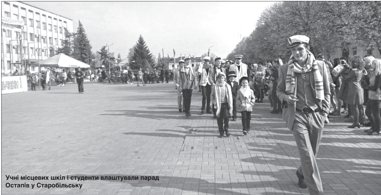
Учні місцевих шкіл і студенти влаштували парад Остапів у Старобільську