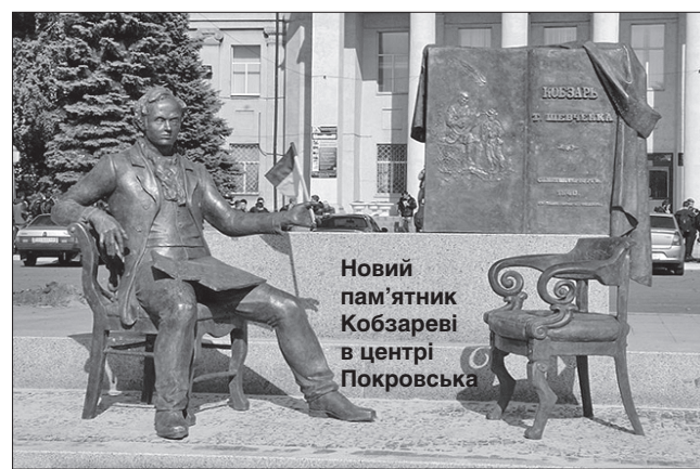
Новий пам'ятник Кобзареві в центрі Покровська

Тож камінь на місці майбутнього монумента встановили ще у березні 2006-го. І лише торік крига скресла: представники місцевої влади, які тривалий час використовували різноманітні можливості, аби, м'яко кажучи, не поспішати з відведенням землі чи наданням коштів, розробленням проєкту чи підготовкою відповідних дозволів і документів, дали зрозуміти: пам'ятнику нарешті бути. А у травні 2019 ро-