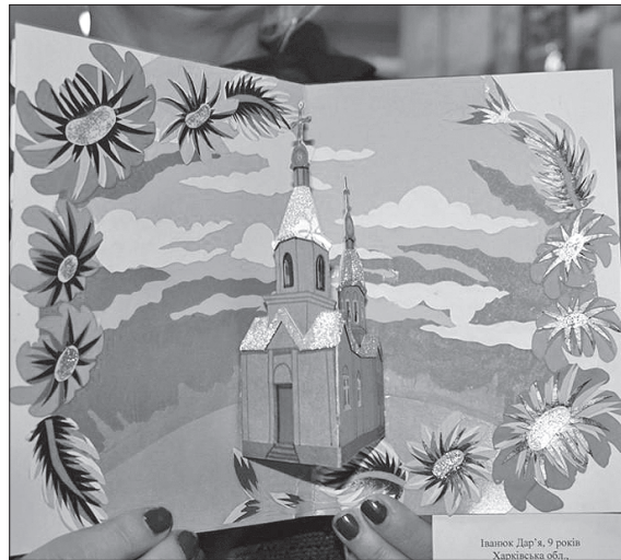
Роботи юних художників підбирали за підсумками відкритого обласного конкурсу дитячого малюнка