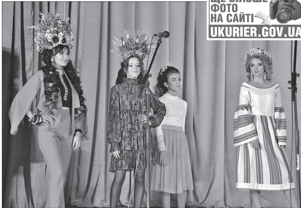
Дефіле у вишиванках нікого не залишило байдужим

Дефіле у вишиванках, «караоке на фонтані», майстер-класи від працівників Будинку дитячої та юнацької творчості, частування пирогом, до випікання якого долучилися відомі в Золотоноші люди, зокрема Герой України Микола Васильченко, народний депутат Олександр Скічко, представник дружньої Іспанії Франциско Гонсалес, міський голова