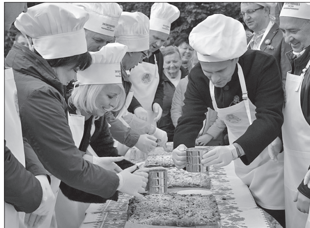
Пекарі в Золотоноші авторитетні

У Золотоноші вміють продуктивно працювати, але й відпочивають цікаво, з розмахом. Відчувається, що тут править бал чуття великої міської родини.