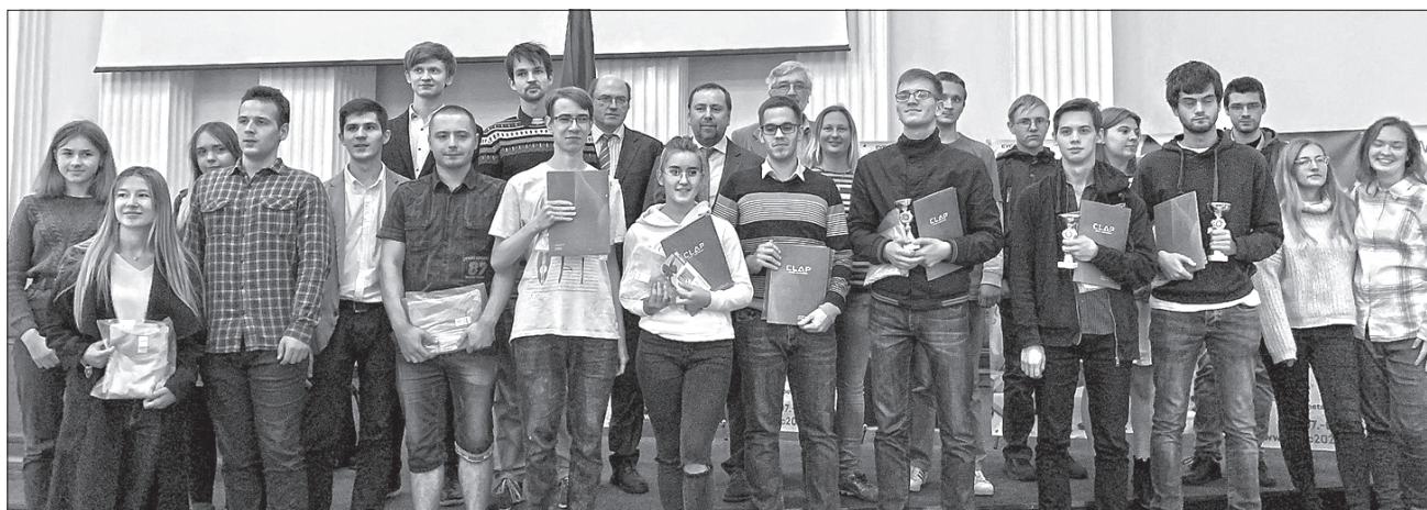
Наші спортсмени показали хорошу гру і гідний результат