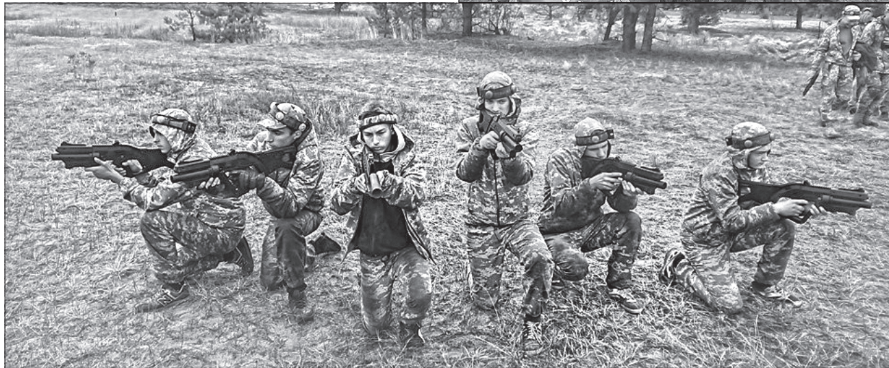
Під час змагань у дітей через гру перевіряли фізичну загартованість та вміння діяти в екстремальних умовах