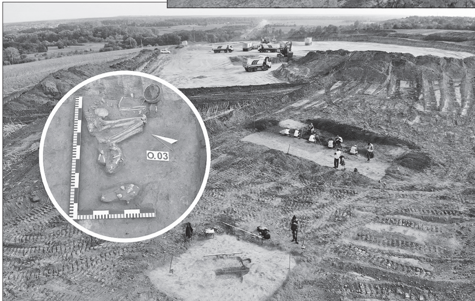
Хтозна, які ще знахідки ховаються у товщі полтавської землі