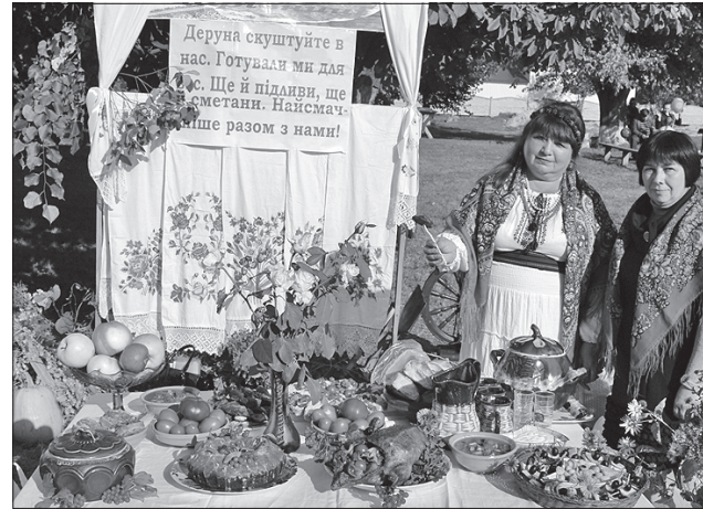
Ох і смачні ж чупахівські деруни!

Для селян влаштували різноманітні виставки, розваги, провели спортивні змагання, а чудовий майже двогодинний концерт подарували студенти Сумського вищого училища мистецтв і культури