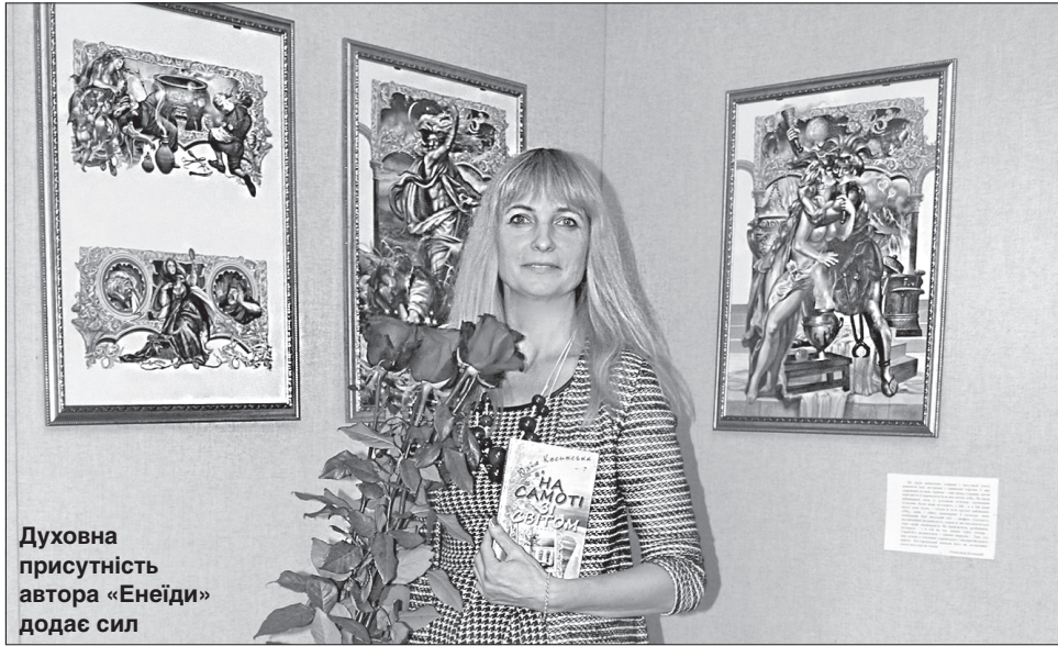
Духовна присутність автора «Енеїди» додає сил

Вірші до першої збірки авторка писала на кількох континентах, де була у мандрах, проте найбільш надихаючим був її