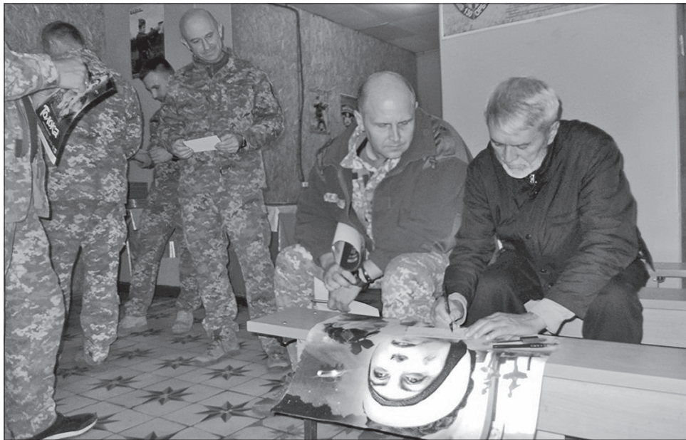
Допрем'єрний показ фільму «Толока» режисера Михайла Ілленка відбувся на Луганщині

МИСТЕЦТВО. Першими на Луганщині відвідали допрем'єрний показ фільму «Толока» медики, поранені та хворі з госпіталю в Северодонецьку. Режисер картини Михайло Ілленко, актори Мирослав Гай і Тетяна Нагірняк розповідали про історію створення стрічки, реальні історії людей, які стали прообразами персонажів. За їхніми словами, фільм виходить за межі відомої поезії Тараса Шевченка з розширенням біографій дійових осіб до масштабів історичних узагальнень від часів козаччини до сьогодення. Далі обраний маршрут привів творчу групу до міста Щастя. Як повідомляє пресслужба цивільно-військового співробітництва «Північ», поспілкуватися з відомим українським кінорежисером та акторами могли учасники аматорського театру однієї з місцевих шкіл. До речі, у стрічці зня-