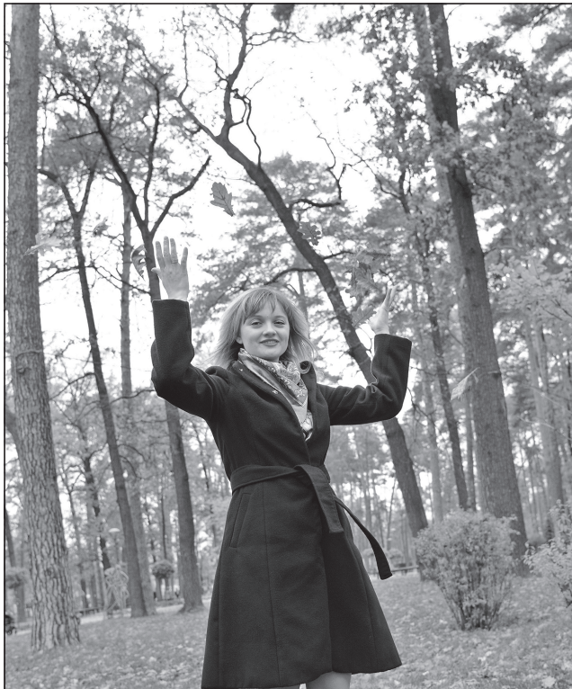
Чи стане другий місяць осені натхненником поетів і фотографів?

заліплюють вічка-льотки воском чи прополісом, зима буде жорсткою, а якщо злегка — теплою. Трохима і Саву (10) вважають своєрідними оберегами божої мучи бджоли. І в наш час на багатьох пасіках можна побачити образки духовних наставників бджолярів.