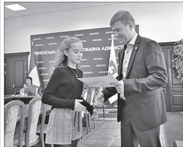
На Рівненщині плекають талановиту юнь

ЗАОХОЧЕННЯ. 75 переможців всеукраїнських та міжнародних олімпіад і конкурсів отримали сертифікати на заохочувальні премії від Рівненської обласної державної адміністрації. Кошти — по 3 тисячі гривень кожному — вже надійшли на їхні банківські картки. Талановиту юнь привітав голова ОДА Віталій Коваль і наголосив: «Пам'ятаймо, ми українці. Маємо плекаті нашу гордість, із любов'ю ставитися до рідного краю, і це обов'язково передається друзям, знайомим, а зрештою іноземцям. Робімо разом кращою нашу країну».