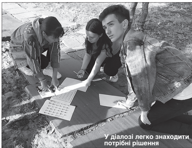
У діалозі легко знаходити потрібні рішення