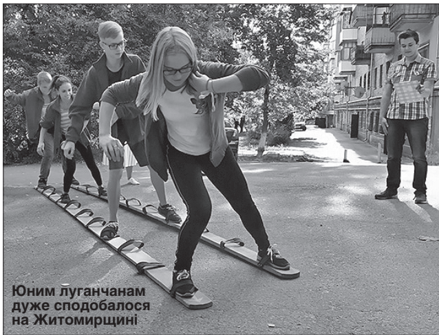
Юним луганчанам дуже сподобалося на Житомирщині