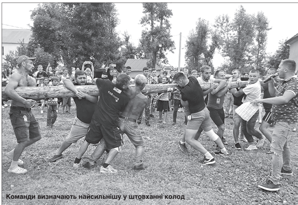
Команди визначають найсильнішу у штовханні колод

ЗМАГАННЯ. Закарпатське село Білки відоме всій Україні тим, що тут народився Іван Фіртач, якого у 1928 році було визнано найсильнішою людиною у світі. Завдяки численним богатырським подвигам його називали ім'ям античного героя Кротона. На знак визнання заслуг Кротона королева Англії подарувала йому унікальний пояс, манжети й шолом, прикрашені діамантами та рельєфним зображенням левів. За мотивами повісті про Кротона український режисер Віктор Андрієнко зняв популярну кінострічку «Іван Сила». У Білках встановлено величний пам'ятник богатырві. Тож не випадково це село стало місцем проведення фестивалю «Богатырська сила», присвяченого 120-річчю із народження людини надзвичайних фізичних можливостей і патріота. Подвигів цього богатыря не забувають. Змагання передбачали сили вправи, назви яких звучать доволі екзотично: серце сили, сільський боулінг, бор-