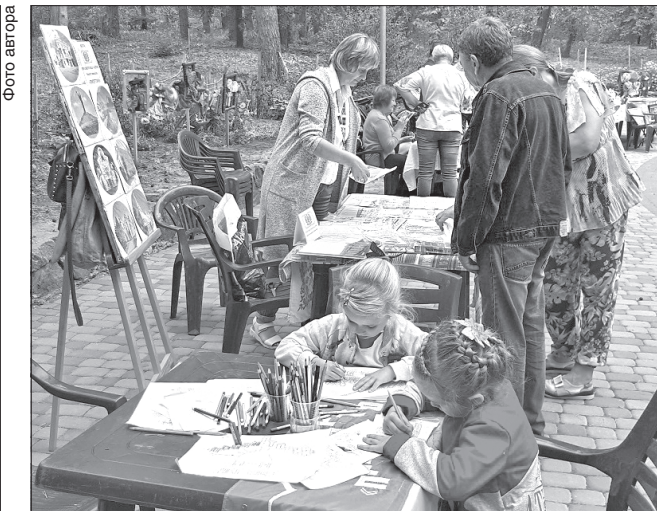
Перегони на саморобних гоночних болідах та захопливі майстер-класи вражали і дорослих, і дітей