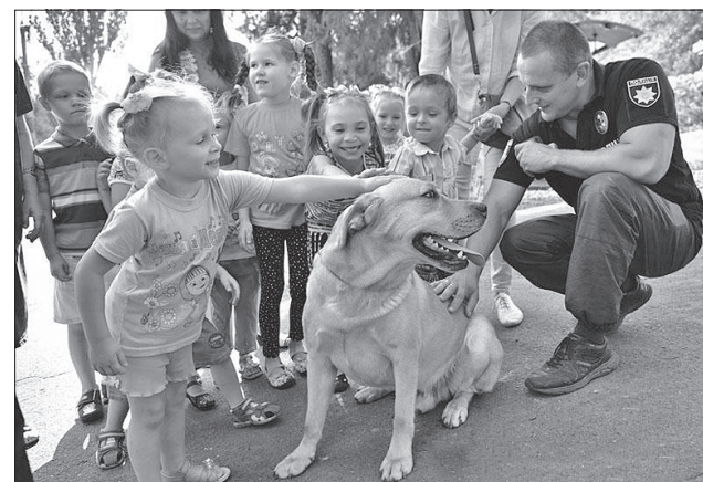
Діти були в захваті від зустрічі зі службовими псами

Юні гості кінологічного центру із захопленням стежили за вмілими діями чотирилапих