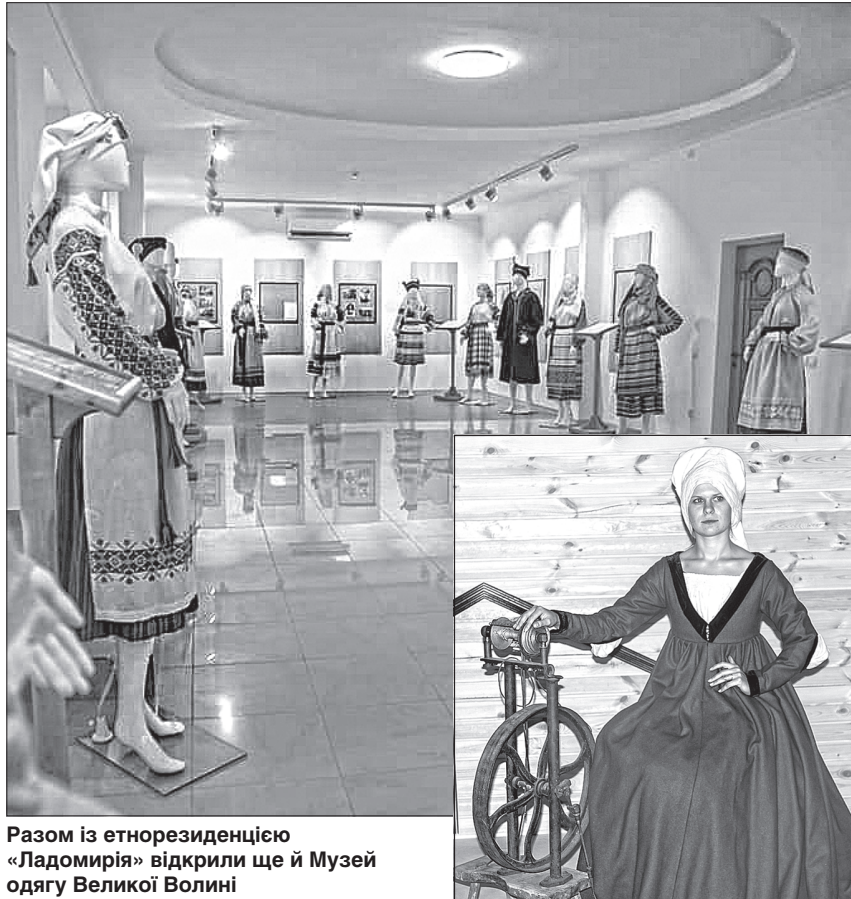
Разом із етнорезиденцією «Ладомірія» відкрили ще й Музей одягу Великої Волині