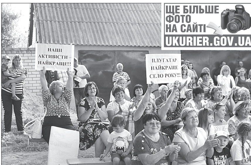
Місцеві жителі активно вболівали за своїх учасниць