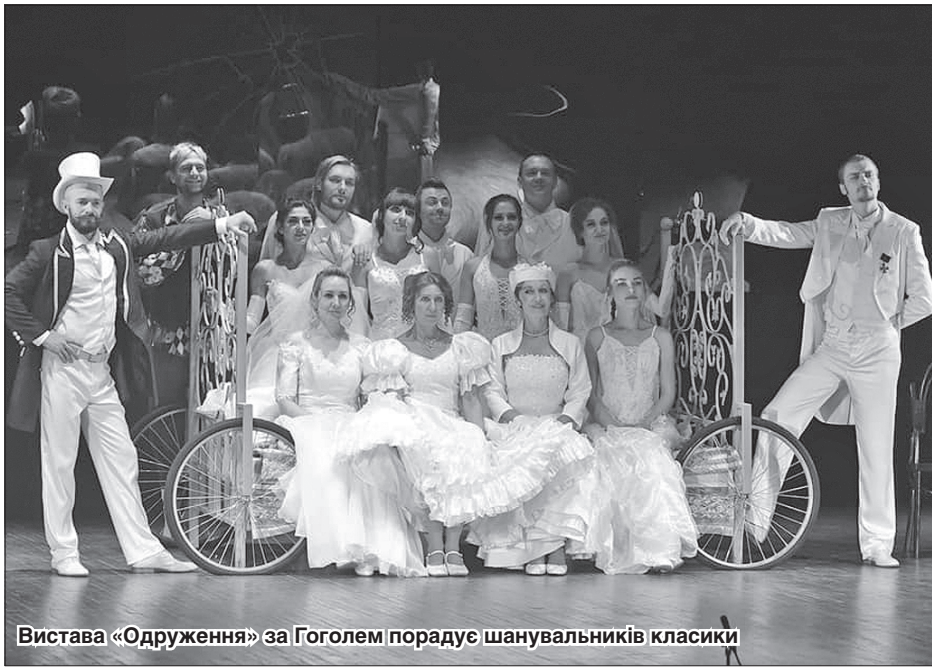
Вистава «Одруження» за Гоголем порадусь шанувальників класики

Цього року колектив і закривав попередній сезон виставами за мотивами Миколи Гоголя. Та якщо містичний «Вій» зазнав суттєвого осяснення, то «Одруження» — цілком традиційна комедія для шанувальників класики. Уже наступного дня колектив вирушив у подорож — на виступ луганчан чекали у дружньому Маріуполі. А тепер творчі люди чекають на II Всеукраїнський фестиваль театрального мистецтва «СвітОгляд», який розпочнеться на Луганщині 17 вересня.