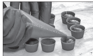
Шоколад має бути не тільки смачним, а й гарно розфасованим

Новий шоколад сертифікували в єдиному українському органі з сертифікації органічного виробництва — «Органік Стан-