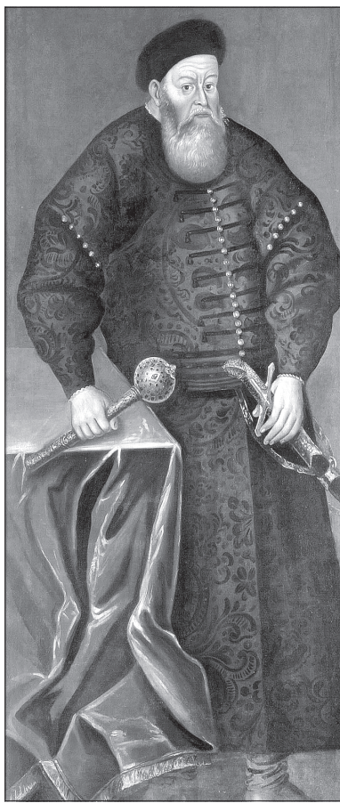
Малюнок з сайту wikipedia.org

Перемога під Оршею прославила князя Костянтина Острозького на всю Європу