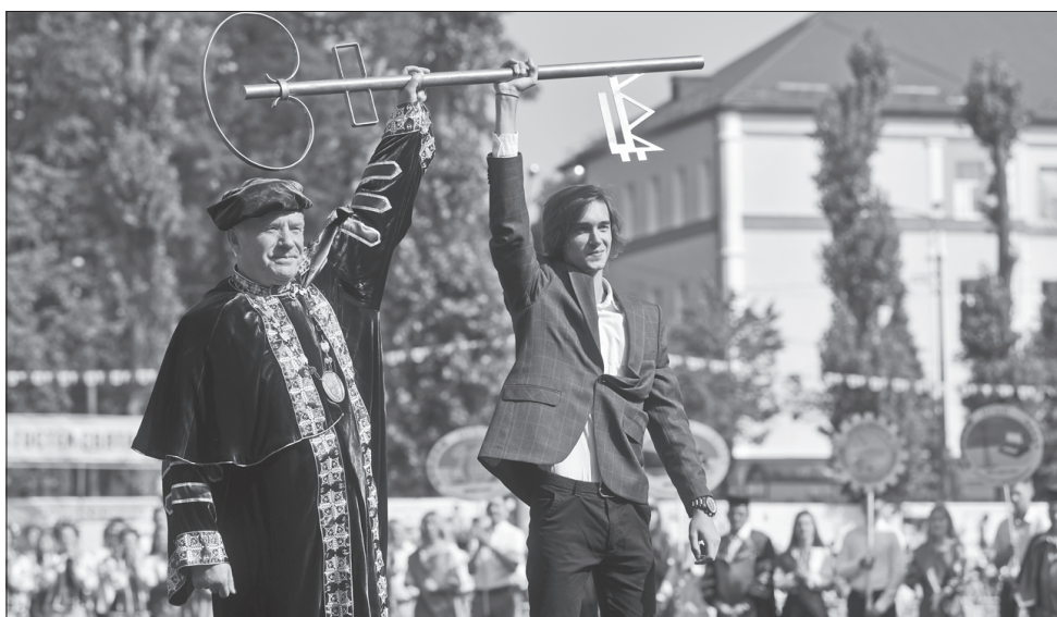
Ректор НУБіП відкривав День знань

Нині НУБіП — один з найбільших університетів Східної Європи, посідає сьому сходинку в українському рейтингу і посилює позиції в міжнародному QS.