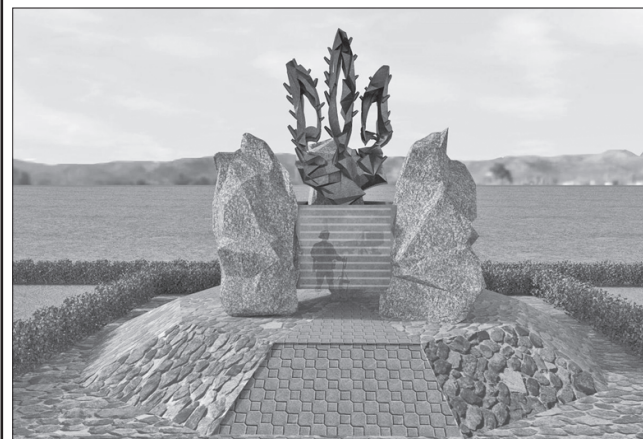
Тризуб виготовлено із залишків боеприпасів із зони АТО