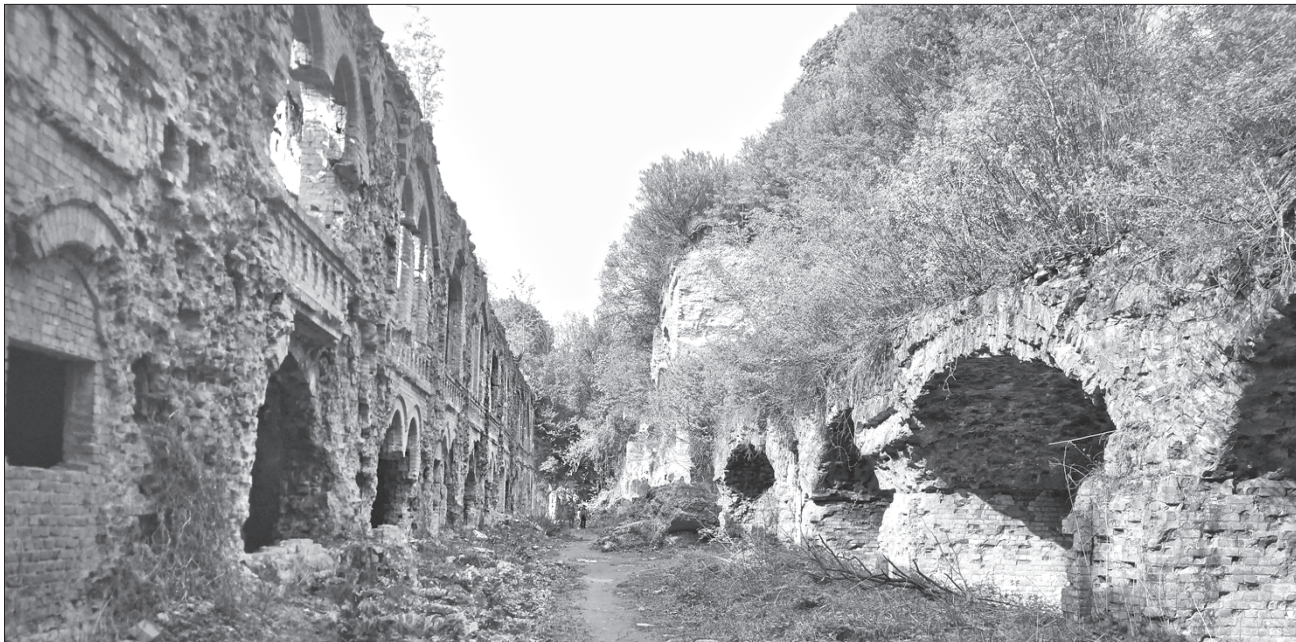
Поблукати Тараканівським фортом тепер можна і під час подорожі, і онлайн