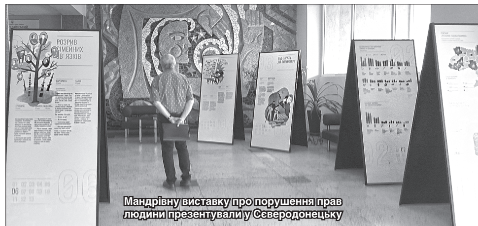
Мандрівну виставку про порушення прав людини презентували у Сєверодонецьку

«Виставку можна назвати експериментом, оскільки ми намагалися створити та-