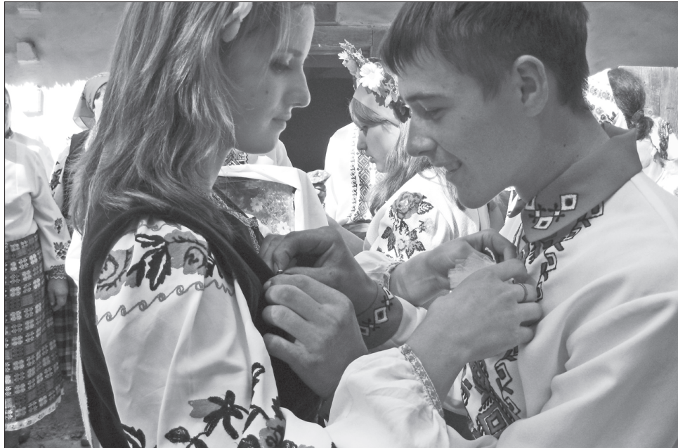
Похід дівчини по калину — вересневий обряд на гарного хлопця і вдале заміжжя

У наш час відроджується свято осіннього Сонця — Весілля Свічки. За церковним календарем цього дня відзначають свято Семена Стопника, з яким пов'язано багато народних прикмет.