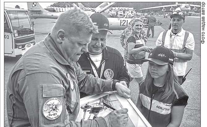
Переможець авіашоу підполковник Юрій Булавка з Миргорода дає автограф

Миргородські військові льотчики-винищувачі перемогли в авіашоу світового рівня «Раят-2019», яке відбулося на базі королівських ВПС у Великій Британії й на міжнародному фестивалі Czech International Air Fest-2017 (CIAF-2017).