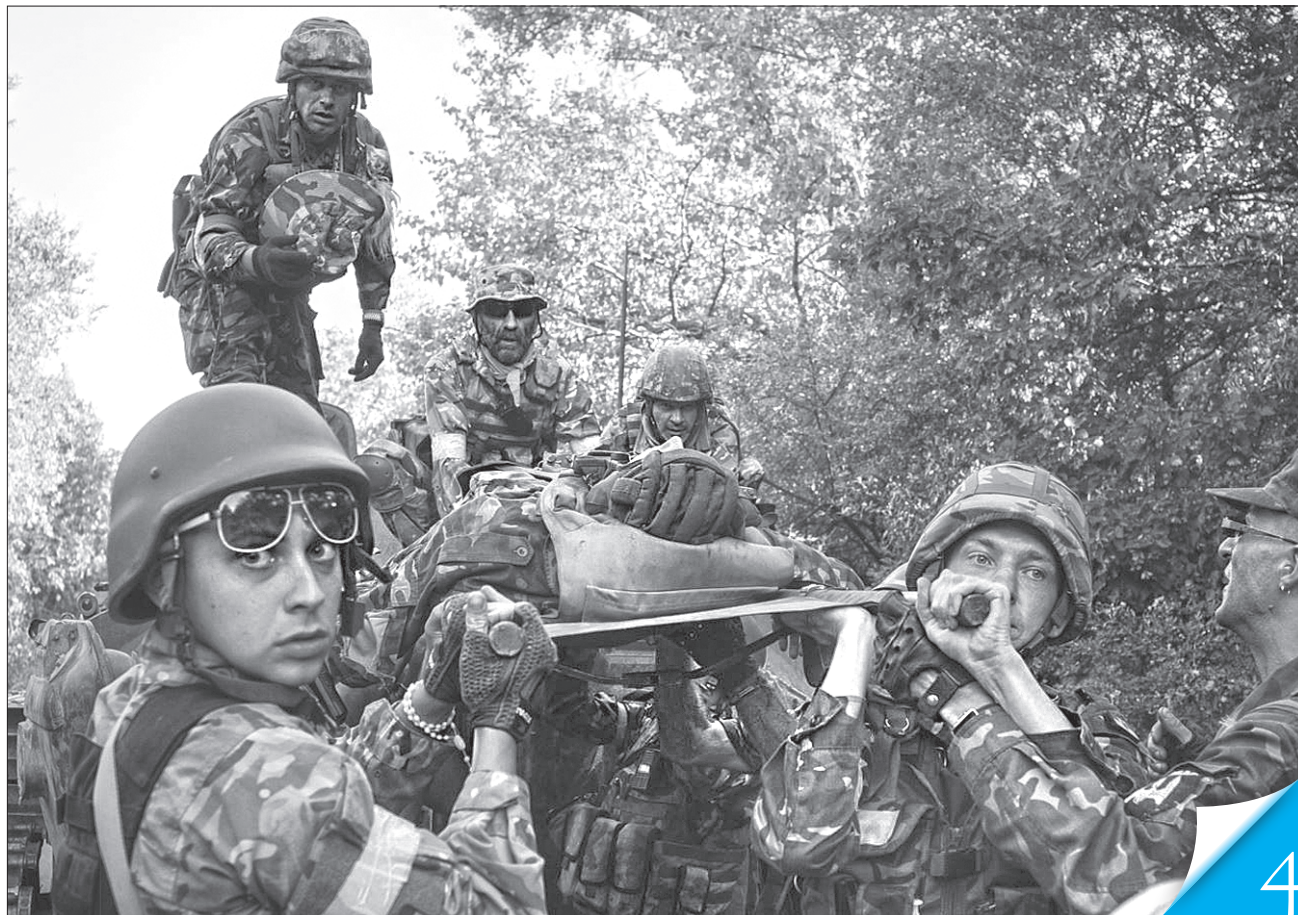
Тільки за офіційними даними, жертвами підлої жорстокості росіян під Іловайськом стала понад 1000 захисників України

ДАТА. Пошанування захисників, які загинули в боротьбі за незалежність, суверенітет і територіальну цілісність України, відтепер відбуватиметься на державному рівні 29 серпня