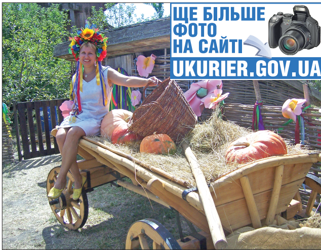
Сфотографуватися на возі прагне кожен гість ярмарку!