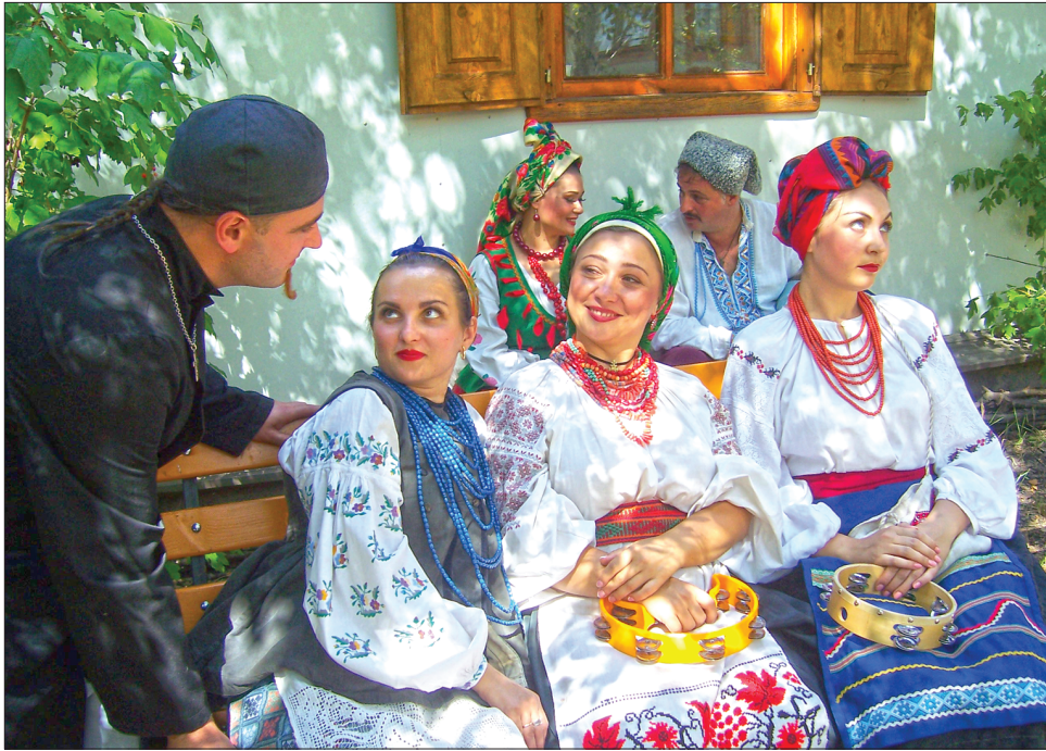
Хтивий дяк знов у своєму репертуарі

«Брилі солом'яні! Купуйте брилі!» — чую збоку. «І почім ваші брилі-красені?» — запитую. «За оцей найбільший (у діаметрі 70—80 сантиметрів) прошу 1000 гривень, а звичайні коштують понад 400 гривень — до художньої безконечності», — сміється майстер.