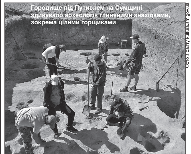
Городище під Путивлем на Сумщині здивувало археологів глиняними знахідками, зокрема цілими горщиками

Нині столичні археологи, які втретє приїжджають до цього населеного пункту, активно ведуть розкопки. Їхні зусилля увінчуються цікавими знахідками і відкриттями. Один з головних підсумків: учасники експедиції розкопали залишки п'яти наземних споруд — своєрідні завали глиняної обмазки різних історичних періодів. Серед знахідок глиняні прясельця, хлібці, грузила для ткацького виробництва, керамічні вироби тощо. Щоправда, як визнають науковці, зовсім мало металевих предметів, що свідчить про те, що свого часу тут уже побували чорні археологи. Частина знайденого, насамперед кілька уцілілих горщиків, передадуть в експозицію місцевого краєзнавчого музею. До слова, цього літа тут проходили польову практику студенти першого курсу історичного факультету Сумського державного педагогічного університету ім. А. Макаренка, які допомагали столичним фахівцям.